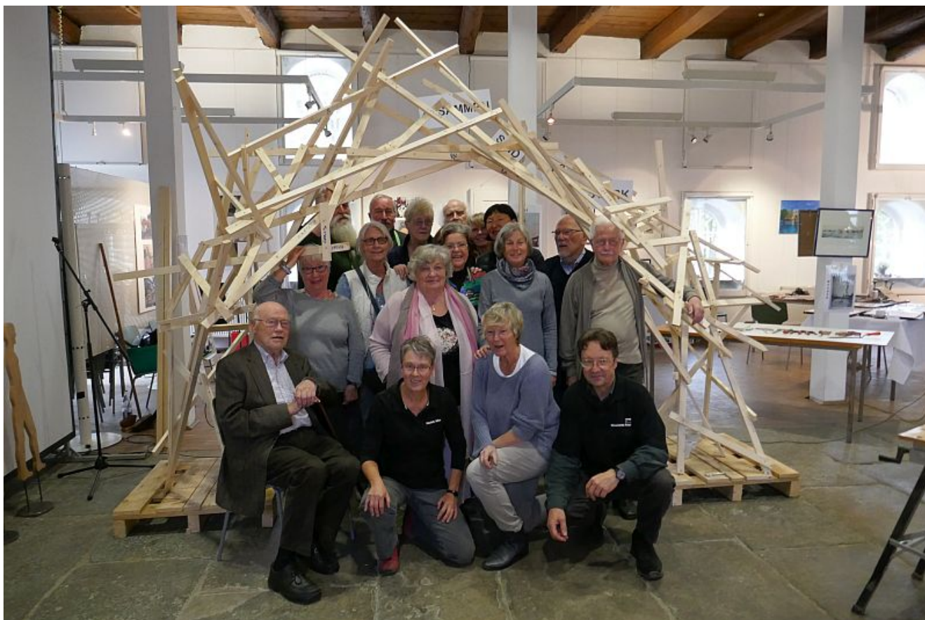
Die Bergkamener Künstlergruppe unterm „Arc de l'Art“.

Die „Kunstnachten“ der Bergkamener Künstlergruppe „Kunstwerkstatt sohle 1“ sind Geschichte. Stattdessen gab es am vergangenen Wochenende erstmals eine Kunstlese. Hier waren die großen und kleinen Besucher zum Mitmachen aufgefordert gewesen.