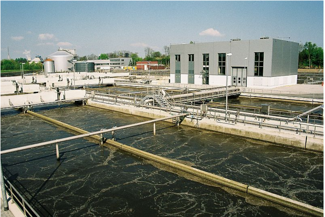
Kläranlage Lünen.

Das Klärwerk Lünen-Sesekemündung, das der Lippeverband im Rahmen des Seseke-programms umfassend modernisiert hat, ist nach Hamm-West die zweitgrößte Kläranlage im gesamten Lippeverbandsgebiet.