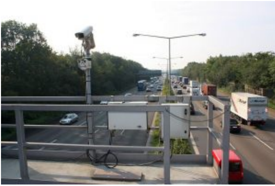
Webcam an der A1.

Wer diese sinnvolle, weil sehr schnelle Informationsquelle nutzen möchte, ruft im Internet die Seite http://www.verkehr.nrw.de/ auf. Es erscheint eine Straßenkarte. Entlang der Autobahnen sind nun die Standorte der Webcams mit einem leider sehr kleinen Kamerasymbol gekennzeichnet. Nach einem Klick auf dieses Kamerasymbol öffnet sich ein Fenster mit zwei Standfotos für beide Fahrtrichtungen. Wenn man nun auf eins dieses Fotos klickt, öffnet sich ein weiteres Fenster, das dann nach ein paar Sekunden ein bewegten Bild liefert.