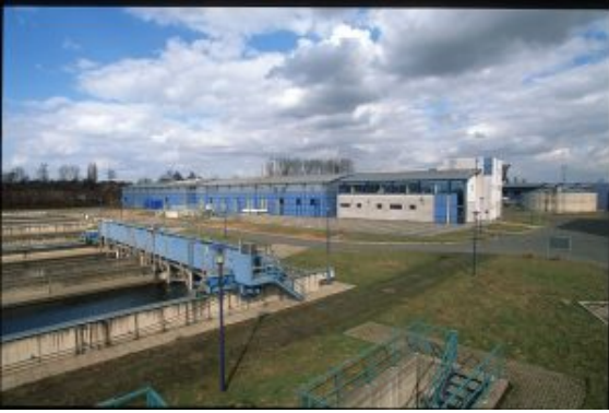
Die Kläranlage (KLG) Kamen-Körnebach.

Heute gehört die Anlage in Dortmund-Scharnhorst zu den größten Kläranlagen des Lippeverbandes. Im Jahr 2016 wurden dort genau 15.214.722 Kubikmeter (15,2 Milliarden Liter) Abwasser – das entspricht rund 180 Millionen Badewannen – gereinigt und sauber in die Körne abgeleitet. Die Körne ist der größte Seseke-Zufluss und bringt an ihrer Mündung fast ebenso viel Wasser mit wie die Seseke selbst.