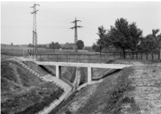
Fußgängerbrücke über dem Kuhbach im Jahr 1937.

Der Grund für diese in Deutschland höchst ungewöhnliche Form der Abwasserbeseitigung lag im Steinkohlenbergbau: Ähnlich wie die Emscherregion waren auch der Dortmunder Nordosten sowie die Städte entlang der Seseke Standorte zahlreicher Zechen. Durch den Abbau der Kohle entstanden untertage riesige Hohlräume, die an der Erdoberfläche zu Senkungen führten. Die Gewässer sanken mit ab und musste vielfach angehoben oder sogar gepumpt werden.