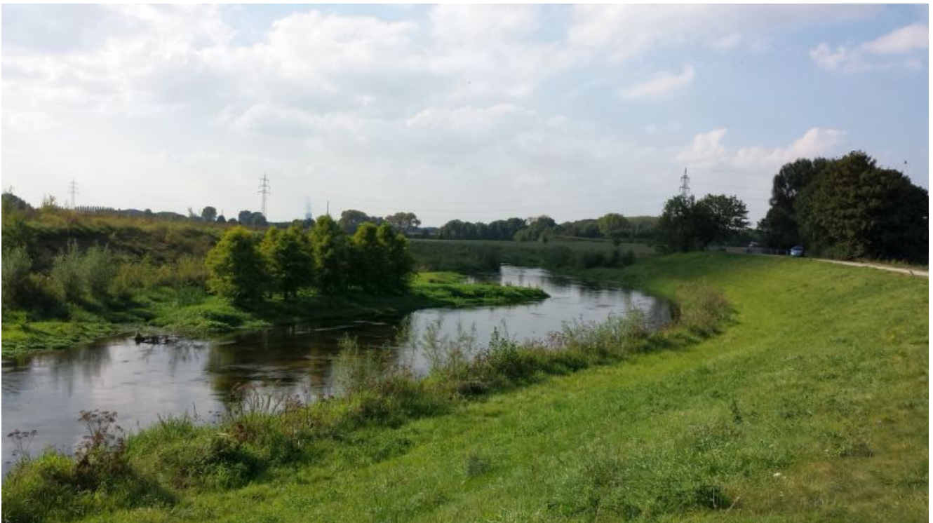
Die Seseke im Süden von Oberaden.

Am heutigen Mittwoch ist Weltwassertag !In diesem Jahr steht dabei das Thema „Abwasser“ im Vordergrund – ein Anlass, einmal über die Abwasserentsorgung in der Region zu informieren: In Lünen, Bergkamen, Kamen und Bönen haben sich die Verhältnisse durch das Sesekeprogramm in den letzten 30 Jahren völlig geändert. In Dortmund, wo der Emscher-Umbau Ähnliches hervorgebracht hat, ist der Umbau der Körne-Oberläufe noch im Gange.