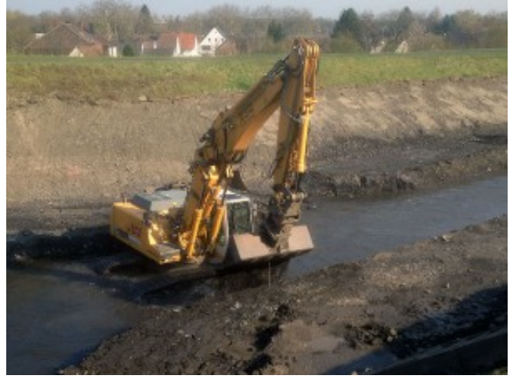
Bagger im Unterlauf der Seseke

Jahrzehnte später war das Ende des Bergbaus in Sicht. Damit stellte sich auch die Frage, ob es jetzt nicht an der Zeit wäre, die zu offenen Abwasserläufen umfunktionierten Gewässer wieder in einen naturnahen Zustand zu bringen. Das „Sesekeprogramm“, das Ende der 1980er Jahre von den Anrainerkommunen und dem Lippeverband beschlossen und vom Land NRW finanziell gefördert wurde, beantwortete dies mit einem klaren „Ja“.