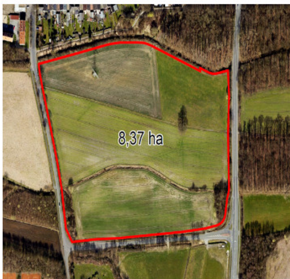
Lage: westl. Industriestr., nördl. „Am Romberger Wald“