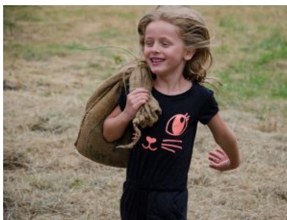
Vollgas beim „Airbag-Run“ der Mini-Highlandgames.