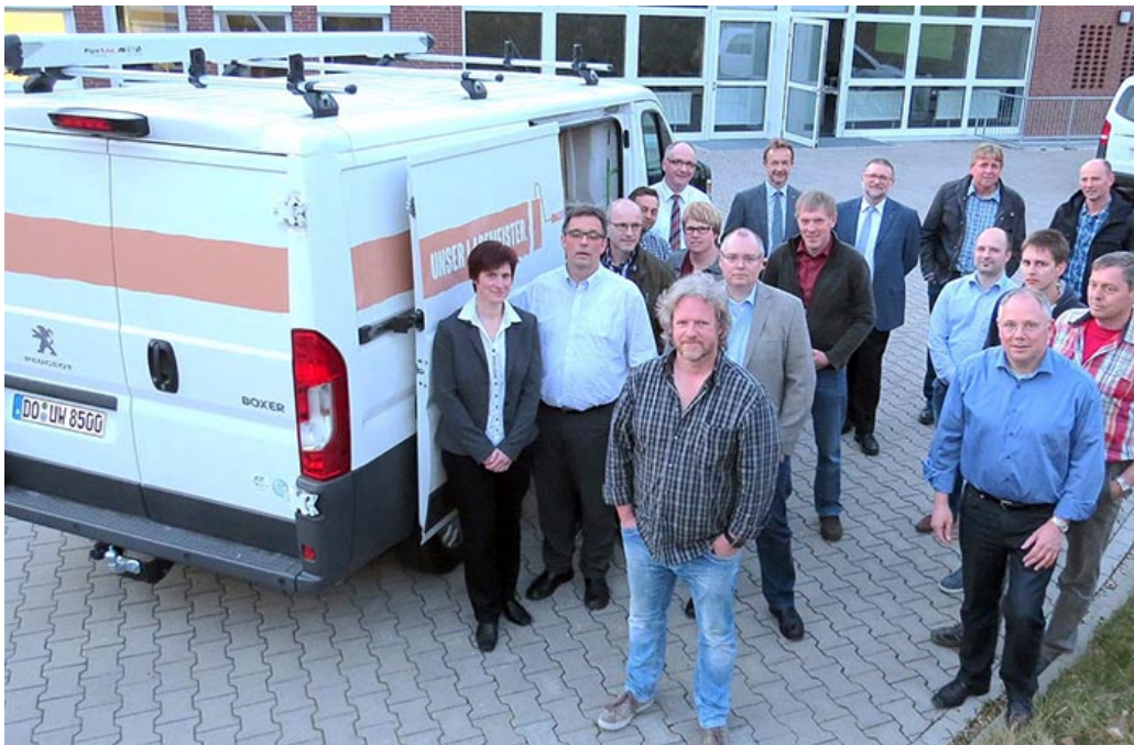
Der neue Transporter wurde jetzt in Selm vorgestellt.

Wenn bei einer plötzlichen Vollbremsung alles von hinten nach vorn fliegt, bedeutet das nicht nur zusätzliche (unnötige) Aufräum- und Reparaturarbeit im Auto. Leitern, Bohrmaschinen, Musterbücher oder Farbeimer werden dabei auch zu wahren Geschossen und sind gefährlich für Leib und Leben der Insassen.