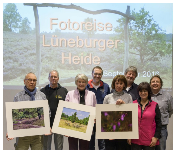
Die TeilnehmerInnen des Fotoworkshops.

Der Naturpark Lüneburger Heide mit seinen einzigartigen Bäumen, sprudelnden Quellen, weiten Heidelandschaften sowie wunderbaren Ausblicken inspirierte im Herbst 2016 die Teilnehmer eines Fotoworkshops des Grünen Rucksacks unter der Leitung von Jörg Weyde zum Fotografieren.