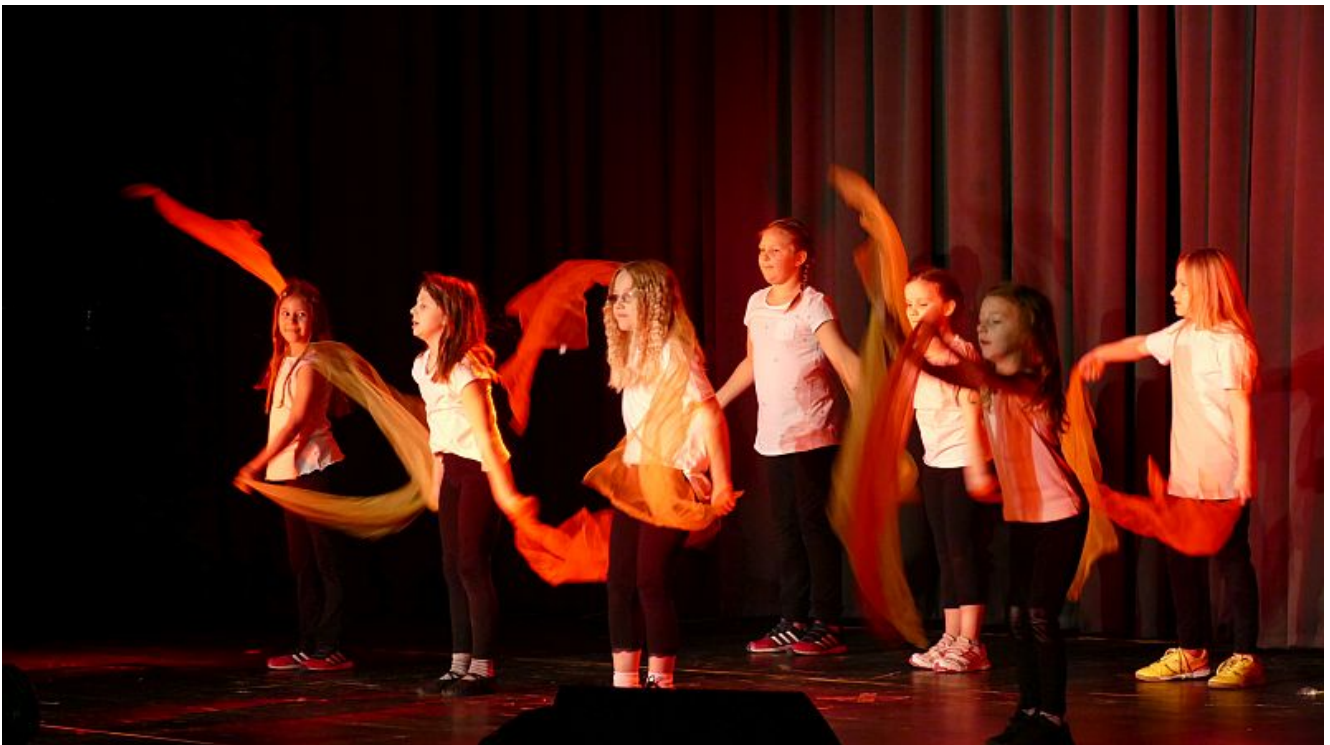
Die neue Tanz-AG der Schillerschule.