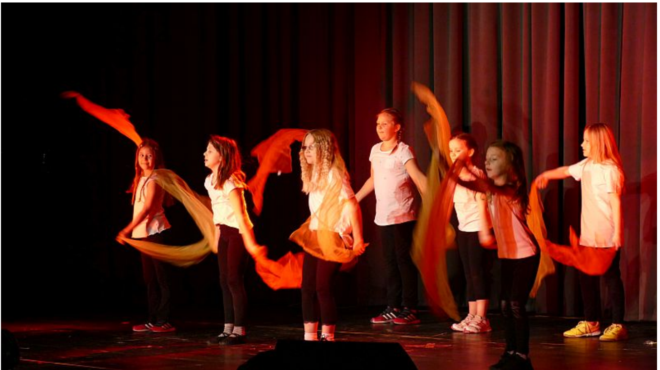
Die neue Tanz-AG der Schillerschule.