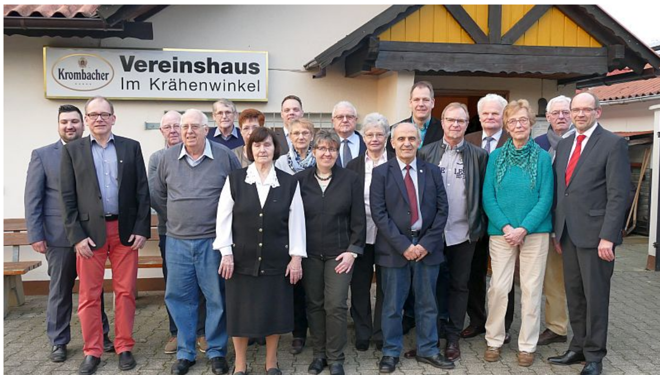
Die Jubilare des SPD-Ortsvereins Weddinghofen.