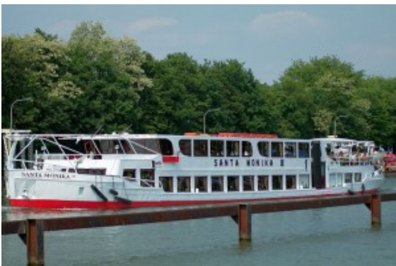
Die Santa Monika

Die Friseur-Innung Unna präsentiert die neuen Modetrends für den Sommer 2017 am kommenden Montag, 20. März, ab Marina Rünthe auf der Santa Monika II.