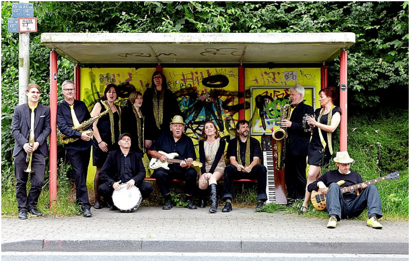
Yellow Express

Auf zahlreichen Gigs in Pubs, auf Uni- oder Straßenfesten haben The Blues Ramblers bewiesen, dass sie ihre Musik auf jeder Bühne richtig auf den Punkt bringen können. Seit der Bandgründung 1999 spielen sie gemeinsam die Musik, die sie am liebsten mögen: eine Mischung aus traditionellem Blues, Rock und Soul. Mit viel Spielfreude, echtem Schweiß und solider Handarbeit setzen die Musiker ihre Leidenschaft für den Blues enthusiastisch miteinander um. Durch Improvisationsteile, Dynamik und die Interaktion der Solisten wird die Musik der Blues Ramblers sehr organisch und lebendig.