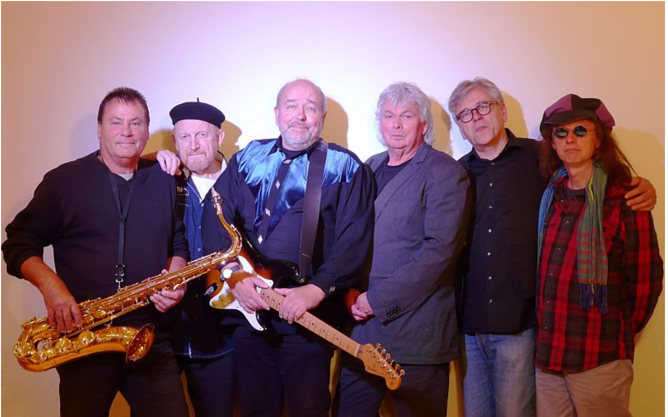
The Blues Ramblers.

Aus der Welthauptstadt des Soul, Bergkamen, zieht der Yellow Express einmal im Monat ins schöne Westfalen, um die Menschheit mit heißer Soulmusik zu beglücken. Aretha ist fast immer dabei, Otis und Wilson natürlich auch. Yellow Express haben eins gemeinsam: die Liebe zum Soul. Ansonsten können die Musiker nicht unterschiedlicher sein, vom Vollblut-Amateur bis zum Semi-Profi, vom Jazzer bis zum Folk-Fan, vom Buchhalter bis zur Sozialarbeiterin ist alles dabei.