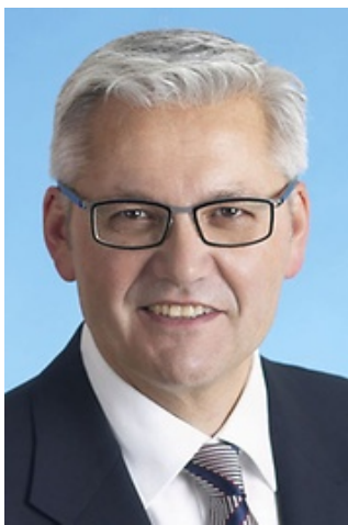
Hubert Hüppe

Der heimische CDU-Bundestagsabgeordnete Hubert Hüppe wurde für zwei weitere Jahre in den Expertenkreis „Inklusive Bildung“ der Deutschen UNESCO-Kommission berufen.