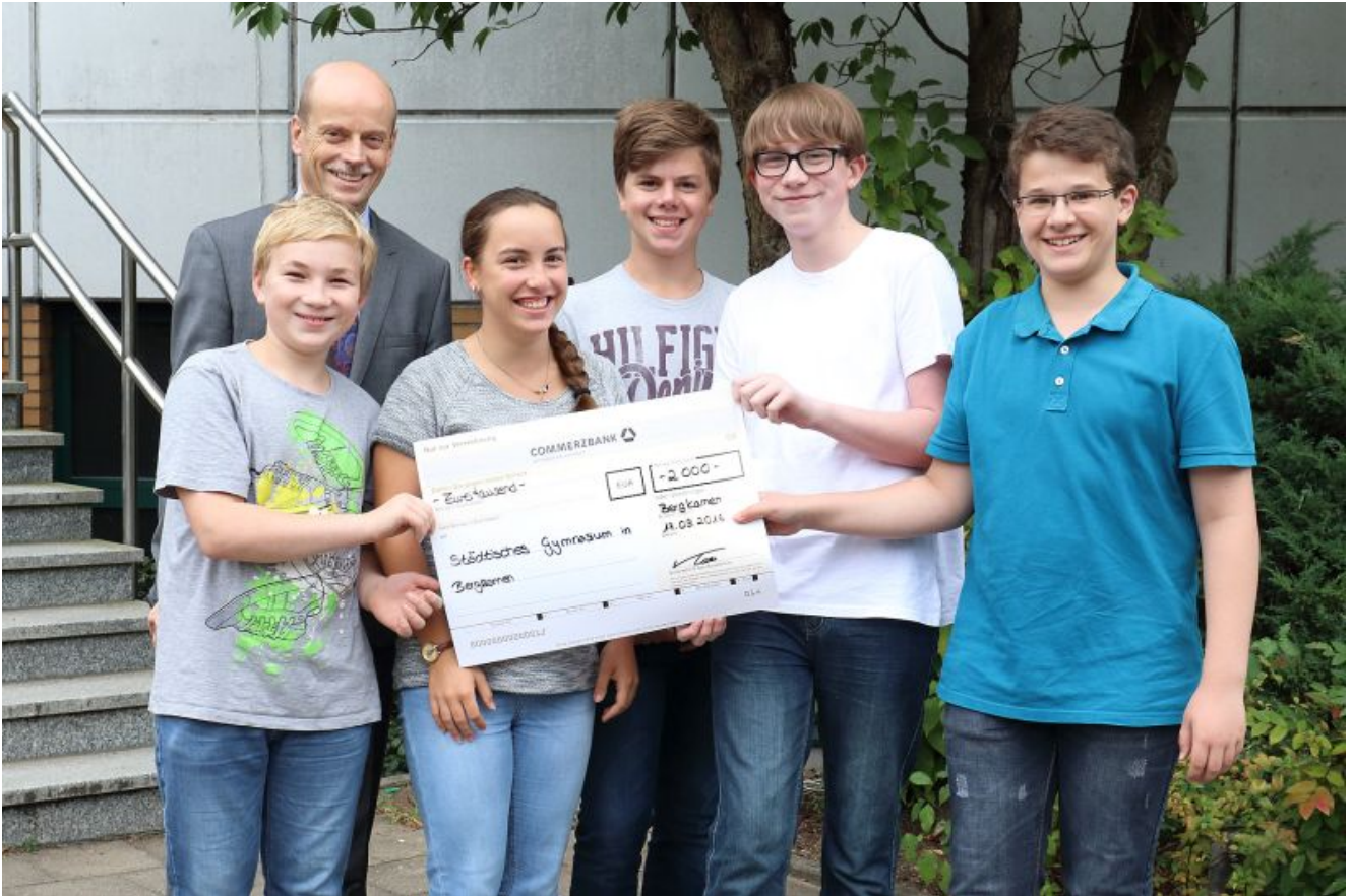
Die 9.-Klässler des Bergkamener Gymnasiums.