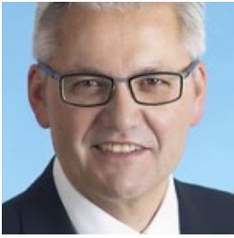
Hubert Hüppe

Der am Wochenende neu gewählte Vorstand der Bundesvereinigung Lebenshilfe hat den heimischen Bundestagsabgeordneten Hubert Hüppe (CDU) in seiner ersten Sitzung einstimmig in den Bundesvorstand kooptiert. „Ich freue mich sehr, dass ich mich dort weiter für Menschen mit sogenannter ‚geistiger‘ Behinderung einsetzen kann. Sie werden oft bei den aktuellen politischen Diskussionen übersehen“, so Hüppe.