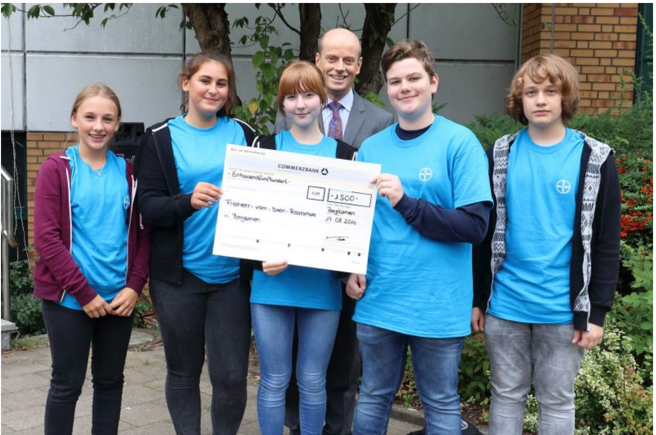
Die 9.-Klässler der Freiherr-vom-Stein-Realschule.