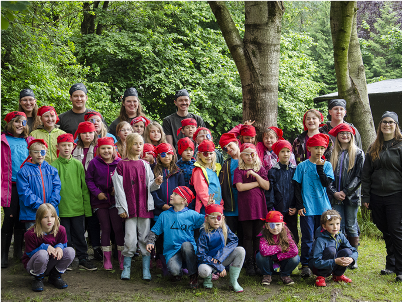
Eine starke Truppe: Die Piraten des 4. Kinderzeltlagers.