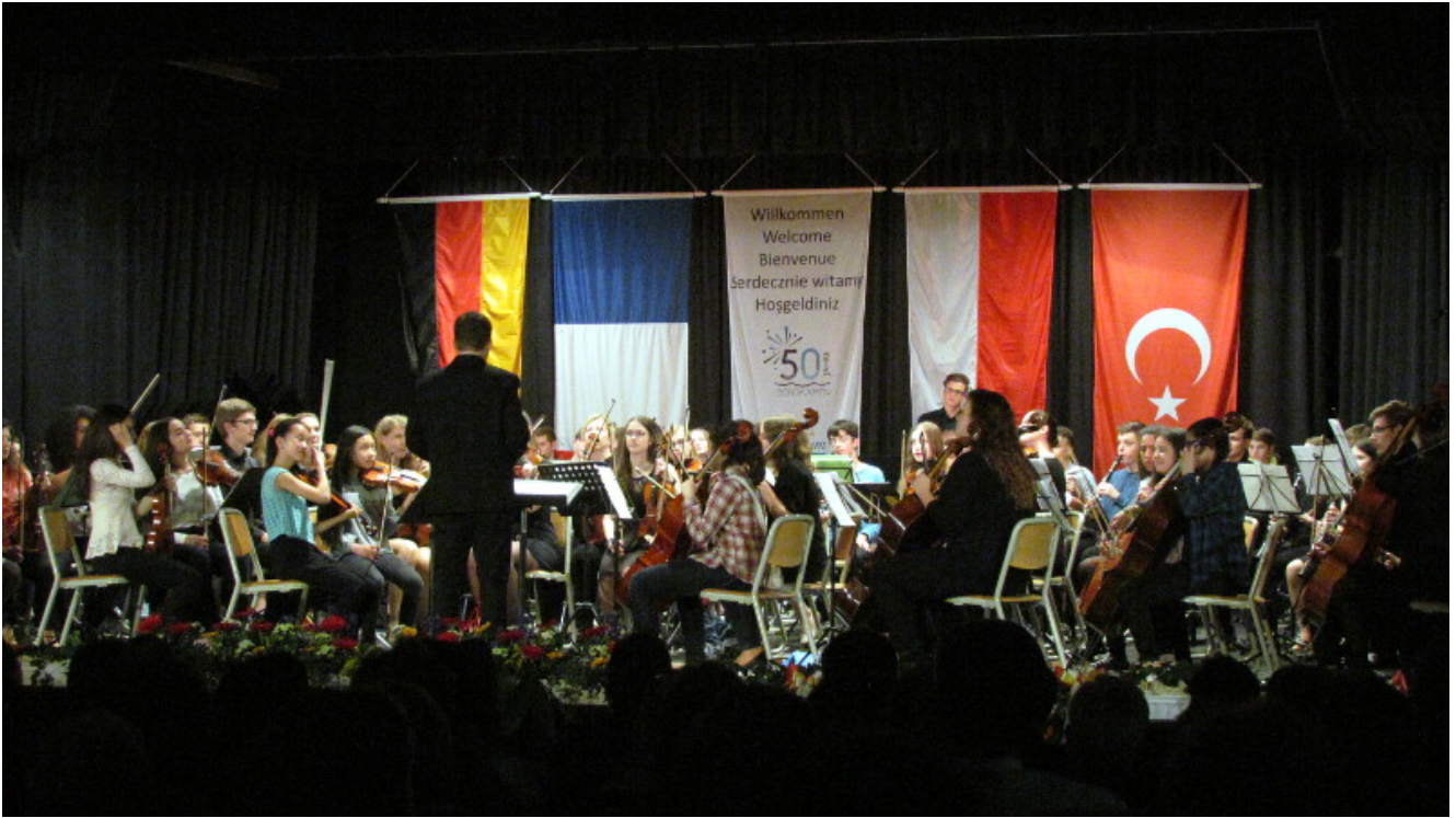
Orchesters des Conservatoire Edgar Varèse der französischen Partnerstadt Gennevilliers