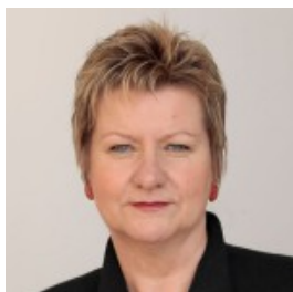
Schulminister in Sylvia Löhrmann

Integration – sei es in den Kindergärten und Schulen im Kreis, in der Familie oder am Arbeitsplatz.