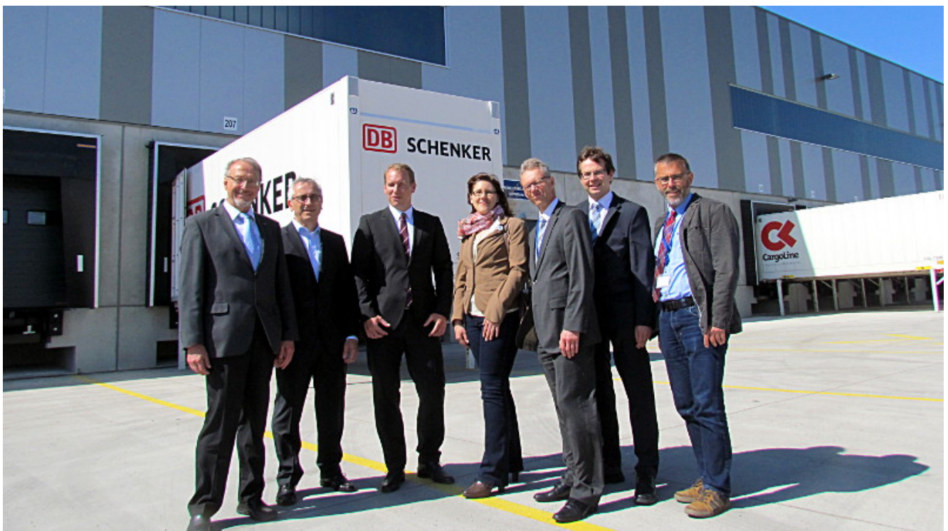
Betriebsbesichtigung bei DB Schenker im Logistikpark A2.

Einen Wok nach China exportieren zu wollen, ist gleichbedeutend wie Eulen nach Athen zu tragen. Meint man. Der Hersteller von hochwertigen Küchengeräten WMF tut dies und seit Juli 2015 spielt Bergkamen, genauer gesagt: der Logistikpark an der A2 dabei eine sehr wichtige Rolle. In der rund 80.000 Quadratmeter großen Halle auf dem Kamm der Lüneburger Höhe befindet sich eines von zwei Verteilzentren von WMF. Von dort gehen Küchenutensilien aller Art vom Besteck bis zur Küchenmaschine in alle Welt. Dazu gehören natürlich auch Woks.