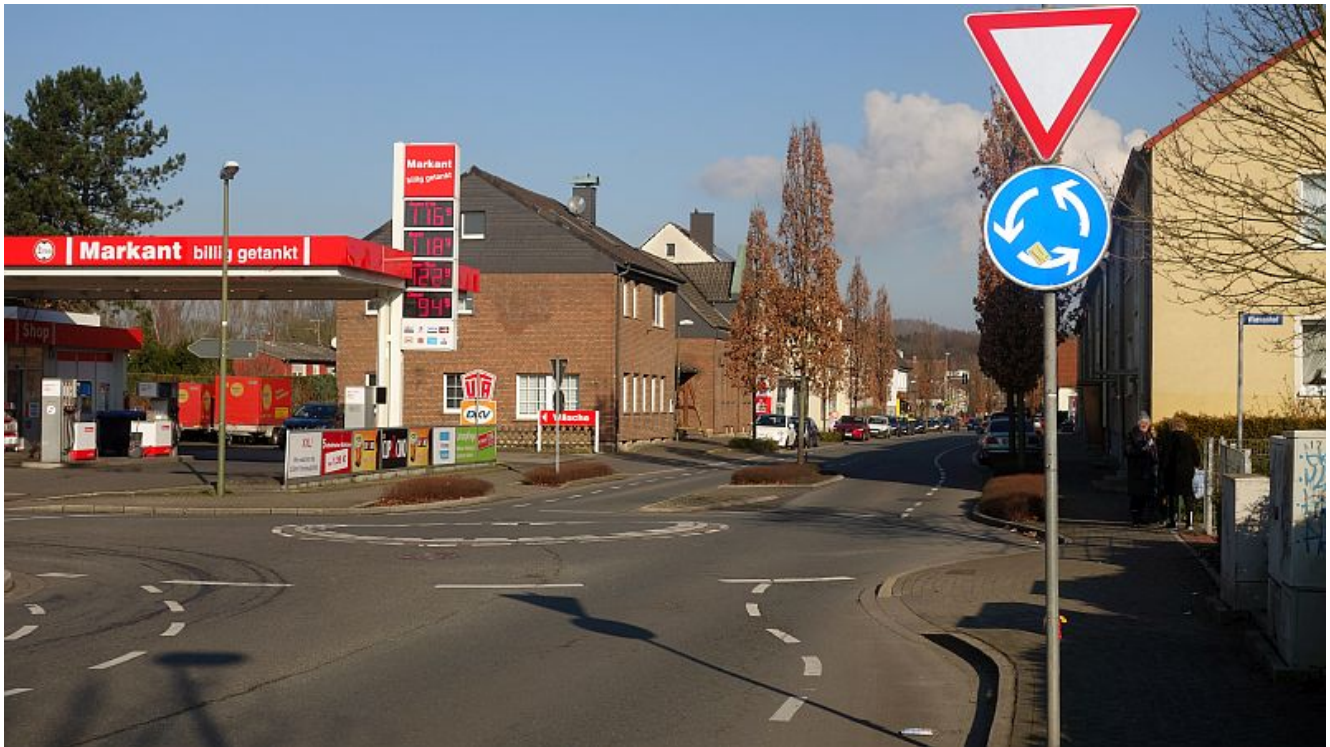
Die Schulstraße in Weddinghofen.

Im März hatte das Baudezernat dem Ausschuss für Bauen und Verkehr eine Untersuchung vorgelegt. Ziel sollte es sein, Wege zur Entlastung dieser drei Straßen zu finden unter der Prämisse, dass die Umgehungsstraße nicht gebaut wird. Ergebnis ist, dass es solche Entlastungsmöglichkeiten nicht gibt. Ein wesentlicher Grund: Ein großer Teil des Verkehrs wird von den Anliegern dieser Straßen selbst erzeugt. Nur ein kleiner Teil, der Durchgangsverkehr, kann verdrängt werden. Das würde aber andere ohnehin viel befahrene Straßen noch stärker belasten.