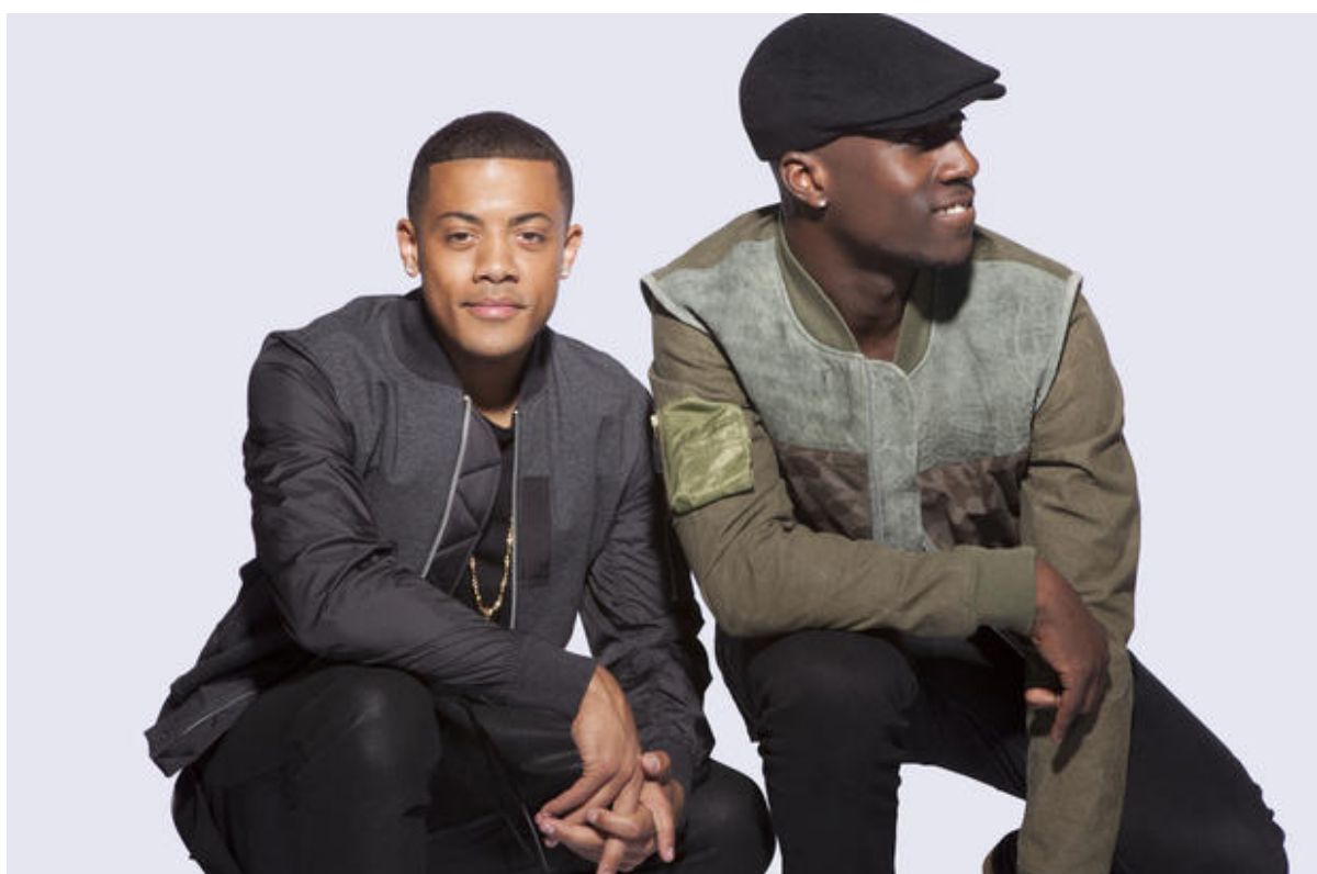
Nico & Vinz