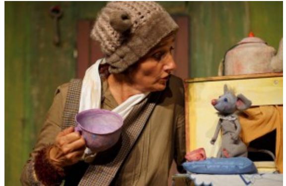
Das Theater Wilde Hummel aus Bochum zeigt „Mausekuss für Bär“