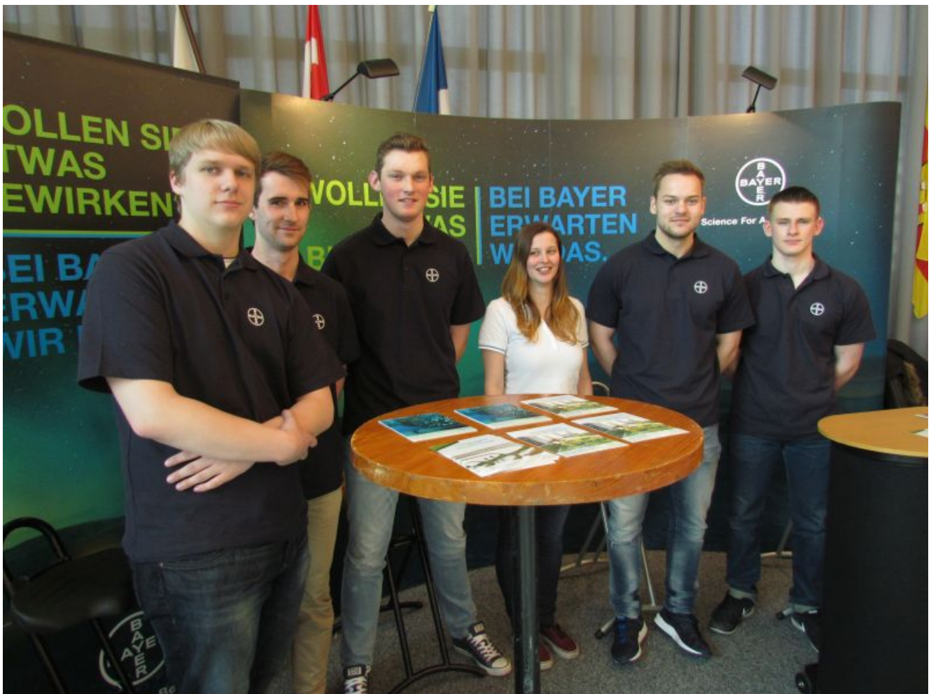
Auszubildende von Bayer informierten bei der Messe „Marktplatz