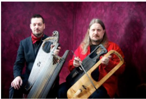
Das Duo Ontrei

Am Montag, 7. März, 20.00 Uhr, präsentiert das Duo „Ontrei“ finnischen Folk im Trauzimmer Marina Rünthe!