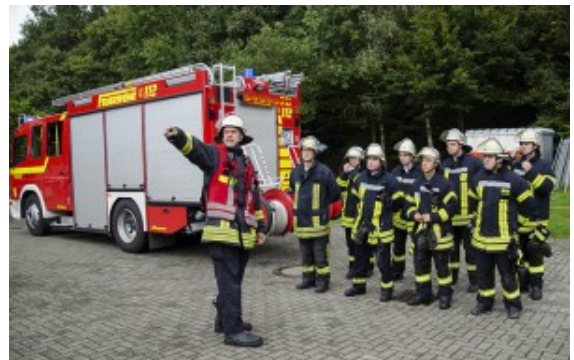
Anweisungen werden gegeben.

unbekannte Chemikalien auf dem Gelände der TÜV-Akademie am Kleiweg entsorgt worden. Die 50-Liter-Fässer schlugen Leck, die Chemikalien strömten aus. Zwei Personen, die das Desaster entdeckt hatten, waren bereits von den giftigen Substanzen außer Gefecht gesetzt.