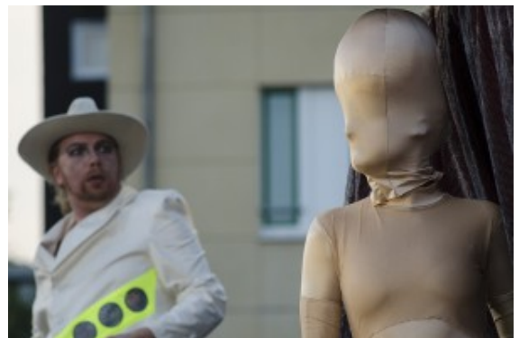
Futuristische Gestalten vor Bergkamener City-Kulisse.

Dass es sich dabei auch noch um eine absolute Premiere handelte, darauf können die Bergkamener stolz sein. Denn sie gehören längst zum Stamm- und Lieblingspublikum der neuen Volkbühne Köln beim Bergkamener Kultur-Sommer. „Die Bergkamener kennen uns schon gut und sehr lang – das ideale Publikum, um einmal aus dem vertrauten Stil auszubrechen und sich etwas zu trauen“, schildert Irene Schwarz vom n.n. theater. Ideal, um sich an der Erstaufführung eines schwierigen Stoffes unter freiem Himmel zu versuchen.