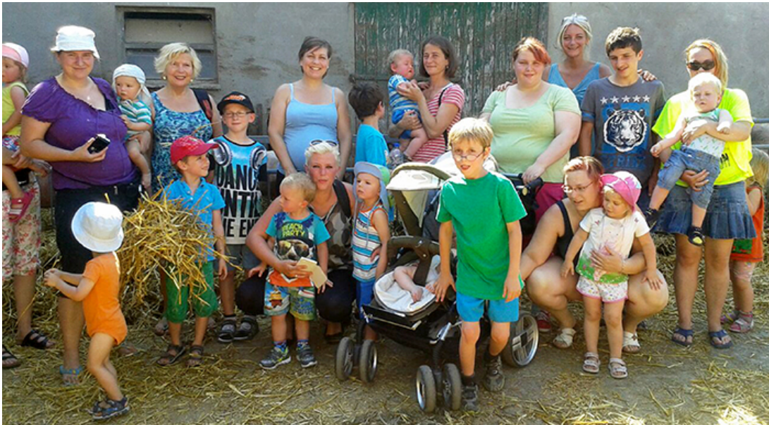
Bei sommerlichen Temperaturen besuchten die Familien den Hof Ecke in Fröndenberg.

Drei Tage ausruhen, entspannen und die Freizeit mit Spiel und Spaß genießen – das stand bei der Familienfreizeit des Familientreffs Bergkamen ganz oben auf der Liste.