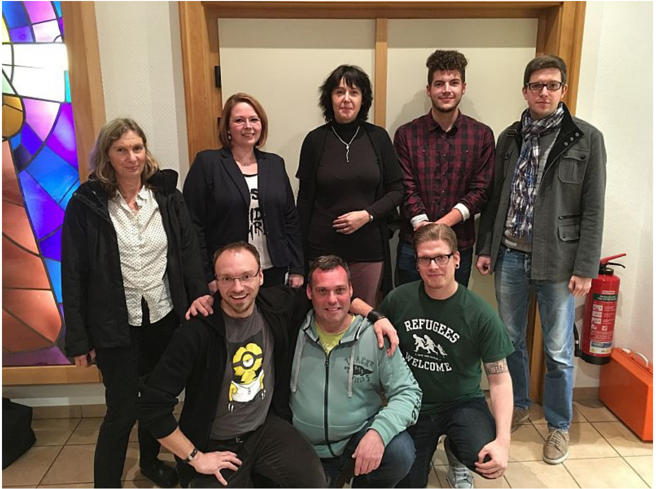
Der Vorstand der Bergkamener Flüchtlingshelfer