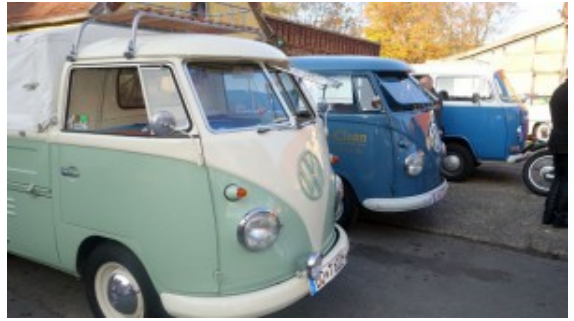
Die Bullys haben noch vorn Ausstellfenster.

„Man glaubt gar nicht, wie viele Oldtimer es allein in Bergkamen gibt“, betont Thomas Albrecht-Tiedemann. Dabei zeigt er auf vier US-amerikanische Straßenkreuzer, die alle Bürgerinnen und Bürger dieser Stadt gehören. Sie fallen allerdings kaum im Stadtgebiet auf, weil sie nur zu besonderen Anlässen aus der schützenden Garage gefahren werden. Zu diesen Anlässen gehörte der Oldtimer-Treff auf dem Hof Keinemann an einem Feiertag mit Bilderbuchwetter.