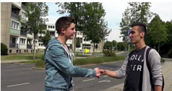
Szene aus „Death Near By“

Der Kurzfilm „Death Near By“ des Literaturkurses des Bergkamener Gymnasiums ist heute, 2. November, um 9.55 Uhr und 23.45 Uhr über NRWISION landesweit im Kabel-TV von Unitimedia oder im Livestream zu sehen. Wer es verpasst hat oder nicht so lange warten möchte, findet ihn auch schon jetzt in der Mediathek von NRWISION und zwar hier.