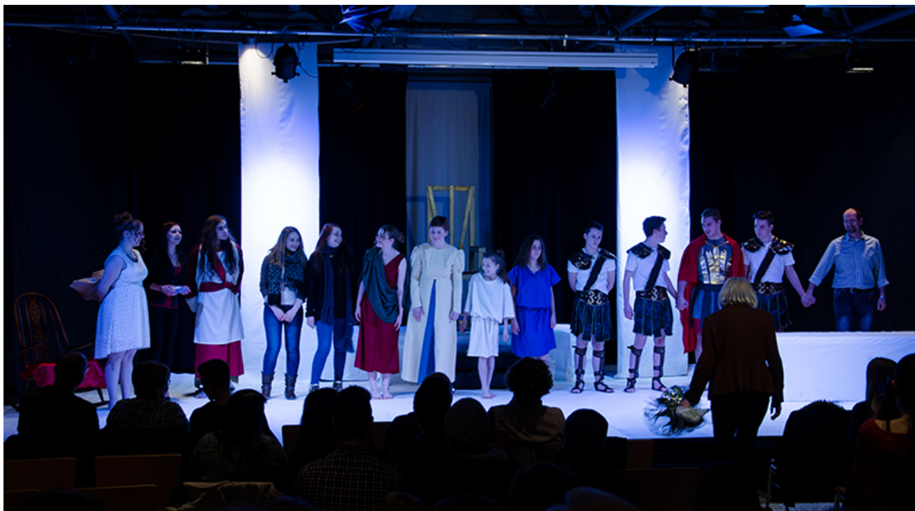
Stehende Ovationen für ein tolles Schauspielteam.