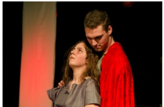
Große Emotionen auf der Bühne: Antigone und Haimon.