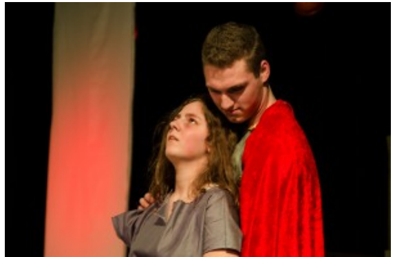
Große Emotionen auf der Bühne: Antigone und Haimon.