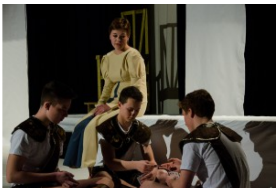
Engagiertes Spiel im antiken Kostüm.

Die bemerkenswert souveräne Schauspieltruppe bewies mit ihrem Einsatz, für den sie ein halbes Jahr lang gearbeitet und seit Dezember intensiv geprobt hat: Das Experiment gelingt. Dem Publikum gingen die zentralen Botschaften in jeder Fassung unter die Haut – ob im antiken Gewand oder im zeitlosen Raum. „Was geht mich deine Politik an? Ich bin mein eigener Richter!“, spuckt Antigone dem König regelrecht ins Gesicht. Ein Satz, der angesichts aktueller weltweiter Geschehnisse