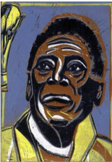
Portraits von Pelé mehrfarbig radiert v