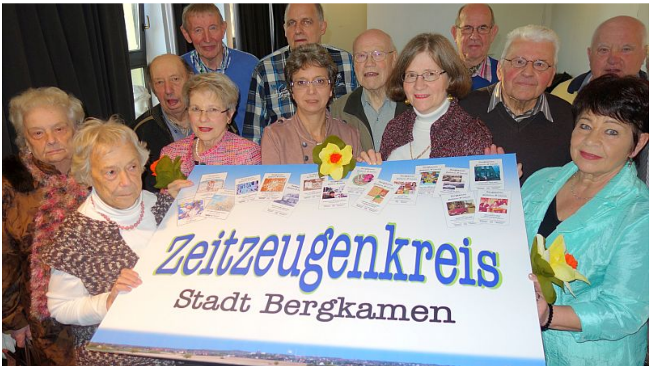
Der Bergkamener Zeitzeugenkreis

Die Stadt Bergkamen feiert im kommenden Jahr ihren 50. Geburtstag. Doch wie war das damals in den 60er Jahren, als es noch die selbstständigen Gemeinden gab, die am 1. Januar 1966 zuerst „Großgemeinde“ wurden und dann am 6. Juni 1966 die Stadtrechte?