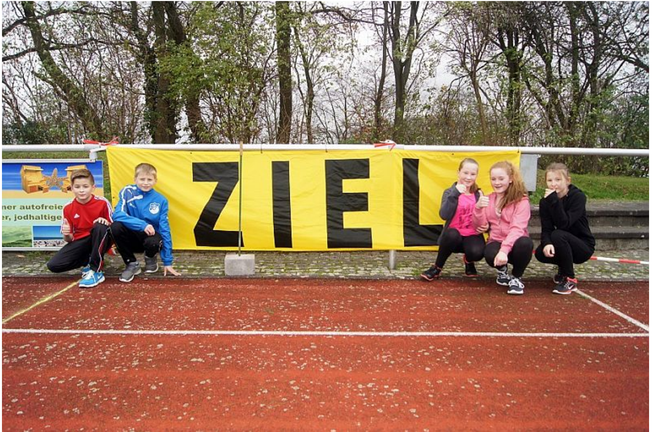
Die fünf „Fitten Füchse“ der RSO beim Barbaralauf 2015