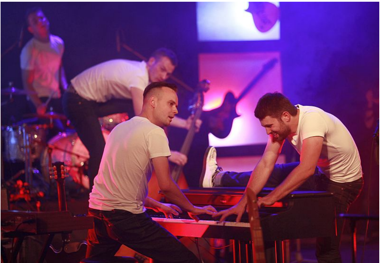
Die Boogie Boys aus Polen.

So international wie in der Saison 2015/16 war der Sparkassen Grand Jam im Haus Schmüling noch nie. Frankreich, Italien, Dänemark und Polen sind einige Herkunftsländer, aus denen die Musiker nach Bergkamen anreisen. Den Auftakt macht am 2. September das Martelle Trio – aus Deutschland.