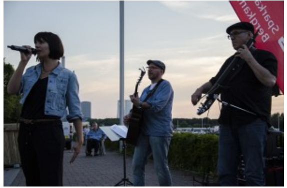
Prima Musik vor Hafen- und Industrie-Kulisse.

Die Idee, von einem Verleiher einen roten Teppich zu ordern und damit dem Kinovergnügen unter freiem Himmel ein kleines i-Tüpfelchen zu verleihen, kam jedenfalls an. Auch das vergrößerte Angebot von kulinarischen Köstlichkeiten fand seine Abnehmer: Popcorn in Riesentöpfen, Riesen-Pommes aus Holland, Fischbrötchen, Hot Dogs und Süßigkeiten lieferten das perfekte Ambiente. Das Vorprogramm mit der Band „Juicy Tones“ sorgte für die richtige Einstimmung.