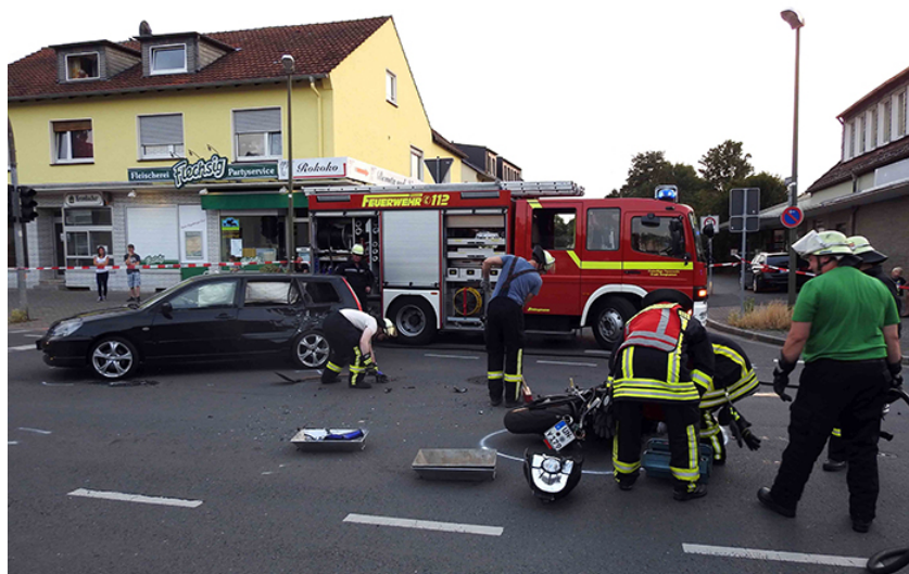
Bei dem Unfall auf der Schulstraße am

Ein 26-jähriger Motorradfahrer wurde am Samstag, 11. Juli, um 20.16 Uhr bei einem Unfall auf der Schulstraße schwer verletzt.