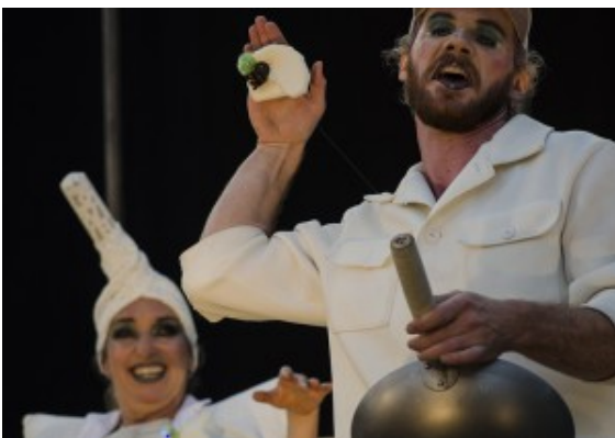
Großartig: Mit kleinen Mitteln und imposanter Spielfreude abtauchen in andere Welten.

Dass es sich dabei auch noch um eine absolute Premiere handelte, darauf können die Bergkamener stolz sein. Denn sie gehören längst zum Stamm- und Lieblingspublikum der neuen Volk Bühne Köln beim Bergkamener Kultur-Sommer. „Die Bergkamener kennen uns schon gut und sehr lang – das ideale Publikum, um einmal aus dem vertrauten Stil auszubrechen und