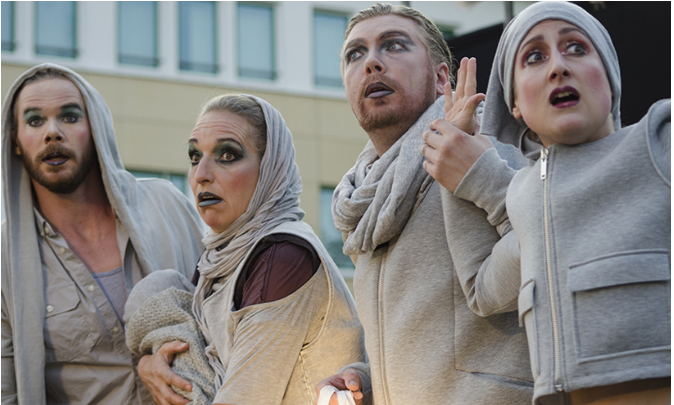
Landen in Metropolis: das Ensemble des n.n. theaters beim Auftakt ihrer futuristischen Zeitreise.