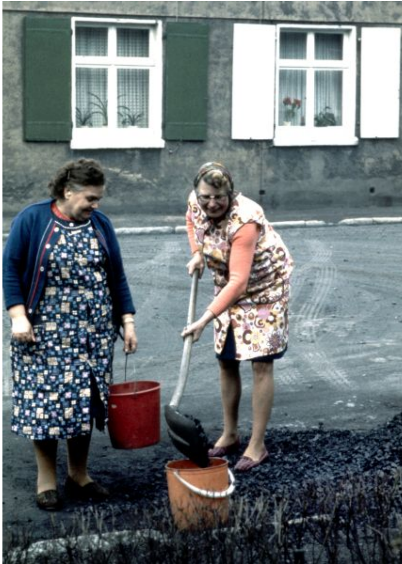
Bergarbeiterfrauen beim Kohleschippen. Foto aus der Ausstellung „Es war mehr als Kohle“ von Ulrich Bonke

Der besondere Schwerpunkt liegt bei diesem Vortrag auf den Lebensumständen der Frauen, die einen Bergmann geheiratet haben oder deren Vater ein Bergmann war. Da schon vor zwanzig Jahren, 1995, eine „Geschichtswerkstatt“ zum Thema „100 Jahre Bergbau in Werne“ vom Museum und Heimatverein Werne gegründet worden ist, konnten noch einige Bergarbeitermänner und -frauen aus ihrem eigenen Leben bzw. dem ihrer Mütter und Großmütter berichten. Dies wurde damals niedergeschrieben und so ist es auch heute noch möglich, authentische Berichte von der Zeit der ersten Hälfte des vorigen Jahrhunderts zu erhalten.