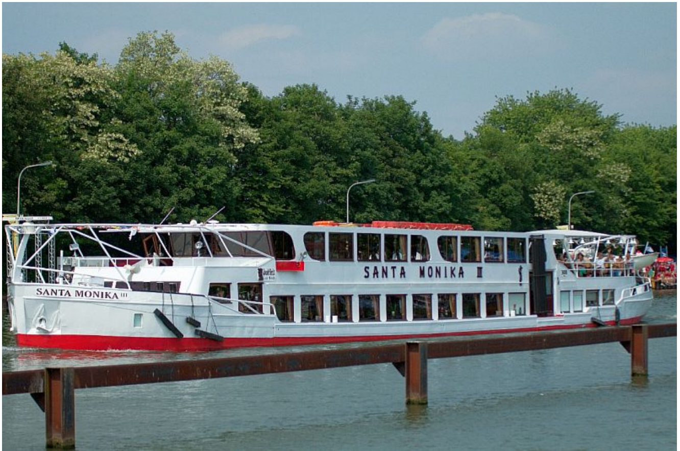
Die Santa Monika III.

Es werden sowohl am Samstag als auch am Sonntag Pendelfahrten ab Lünen-Preußenhafen angeboten: Samstag um 12.00 Uhr und 18.00 Uhr sowie am Sonntag um 12.00 Uhr. In einer knappen Stunde fährt man auf dem Datteln-Hamm-Kanal vorbei an Wiesen und Feldern bis zur größten Marina in Nordrhein-Westfalen.