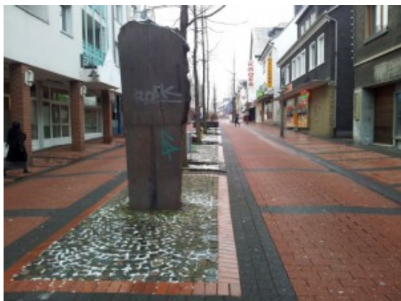
Nordberg - Fußgängerzone

in das Seniorenheim „Haus am Nordberg“, Albert-Einstein-Straße 2, ein.