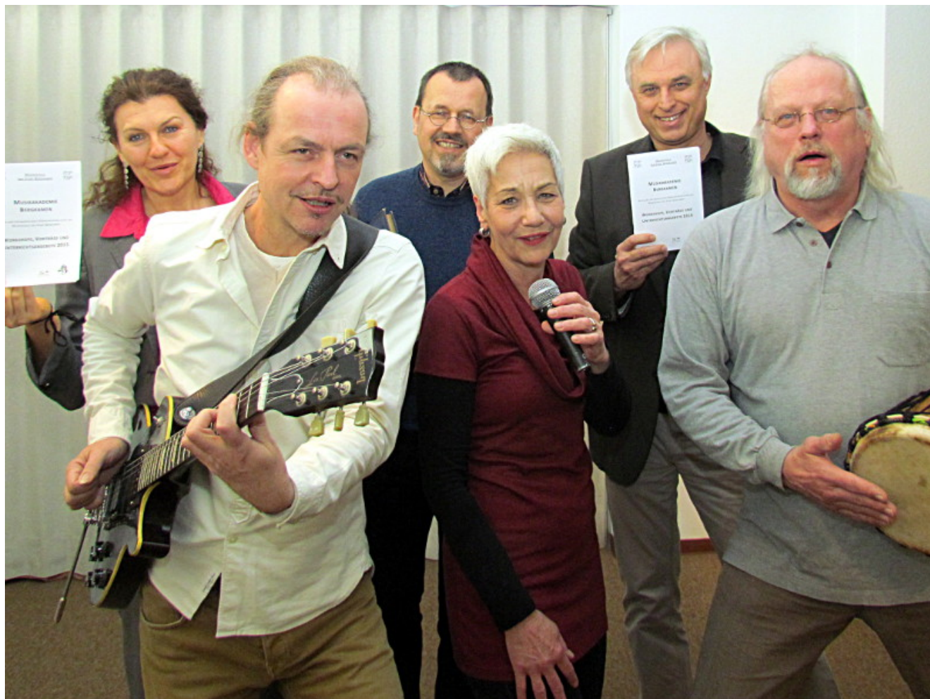
Die Dozenten der Bergkamener Musikakademie.

Bergkamen startet mit einem neuen Angebot speziell für Erwachsene nach den Osterferien. Der erste Termin beginnt am 17. April 2015, die letzte Veranstaltung in diesem Jahr findet am 28. November statt.