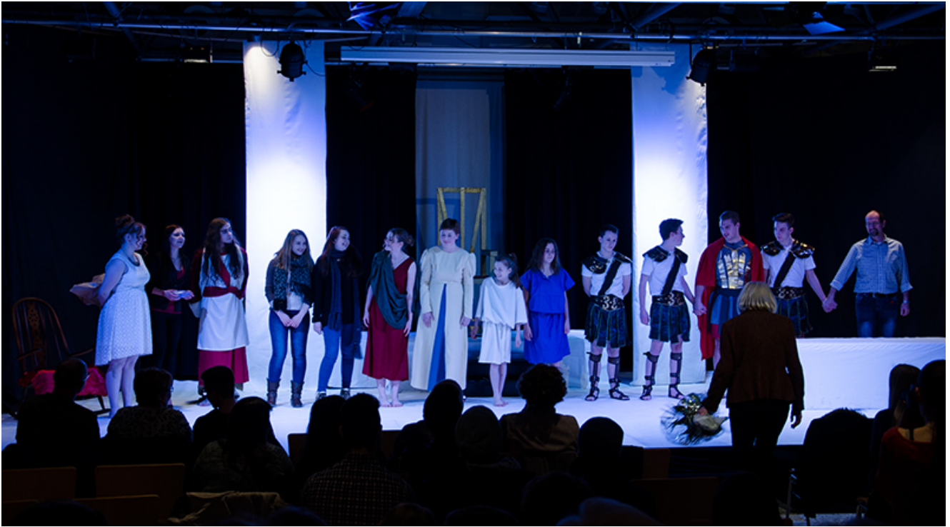
Stehende Ovationen für ein tolles Schauspielteam.