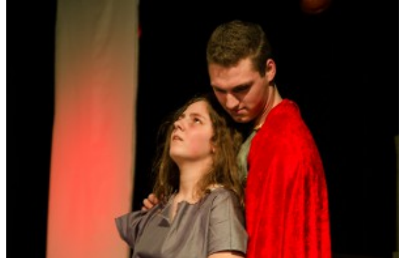
Große Emotionen auf der Bühne: Antigone und Haimon.

einem jungen Nachwuchsstar aus der Theater-AG für ihre spannende Zeitreise ausgesucht. „Ein anspruchsvolles Vorhaben“, wie Schulleiterin Bärbel Heidenreich mit großem Respekt betonte.