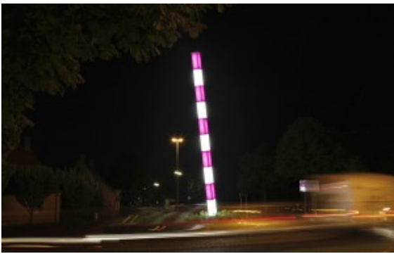
Eine der vier Lichtkunststelen der Brüder Löbbert im Kreisverkehr.

Der Vortrag „Einführung in die Lichtkunst Bergkamens“ mit Gästeführer Klaus Holzer findet am Dienstag (7. Oktober) um 19.30 Uhr, im Sitzungssaal 2 des Ratstraktes des Rathauses statt (Eintritt frei) und dient der Vorbereitung der Führung zum Thema durch Bergkamens Innenstadt am kommenden Freitag, 10. Oktober 2014, ebenfalls um 19.30 Uhr.