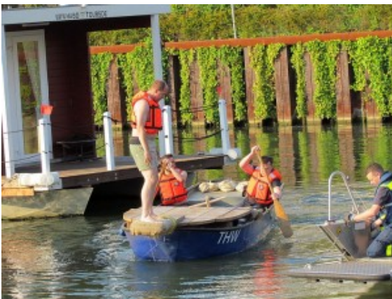
Training für das Fischerstechen

Das Fischerstechen hat seinen Ursprung in einem so genannten Zunftbrauch der Fischer, der beispielsweise im süddeutschen Bamberg auf eine Tradition zurückgeht, die bis in das 15. Jahrhundert zurückreicht. Dabei handelt es sich um ein Turnier nach Ritterart, das allerdings nicht mit Pferden, sondern „standesgemäß“ mit Booten ausgetragen wird. Die Fischerstecher stehen bewaffnet mit einer stumpfen und gut gepolsterten Turnierlanze auf den Spitzen ihrer Boote, die durch Ruderer aufeinander zu gefahren werden. Wenn die Boote in gegenseitige Reichweite kommen, dann versuchen die Fischerstecher, sich mit ihren Lanzen vom Boot ins kalte Nass zu stoßen.