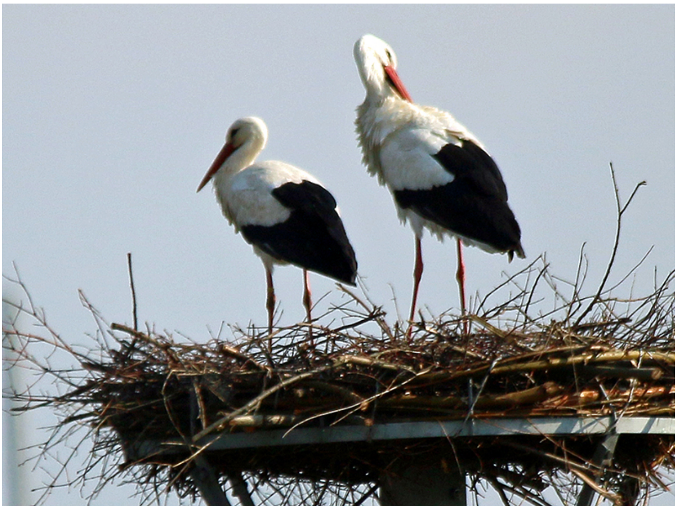
Störche in den Lippeauen in Bergkamen-Heil.

Mehrmals haben in den vergangenen Jahren Störche die Nisthilfen der Biologischen Station in den Lippeauen in Heil in Augenschein genommen. Jetzt hat sich ein Paar dort wohnlich niedergelassen und will offensichtlich dort auch den Nachwuchs großziehen.