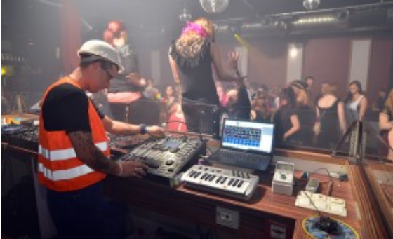
Die Disco Musicpark A2.

ärgerlich“, sagt Buchwald. Denn in der Discothek müsste einiges investiert werden. „Das machen wir natürlich nicht, so lange wir nicht wissen, wo sich die Disco schlussendlich befindet.“