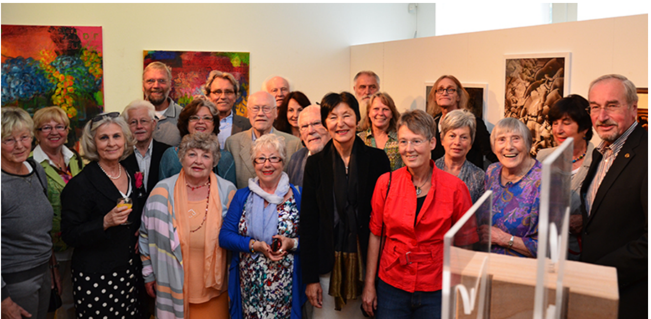
Die Künstlerinnen und Künstler der Kunstwerkstatt sohle 1.

Träume im Schlaf, Lebensträume, Kindheitsträume, Traumwelten, Traumvorstellungen. Manchmal stecken sie als Schaufensterpuppe hinter Stacheldraht, dann spiegeln sie sich in Kästen, werden von Federn eingefangen oder sind Formen im Plexiglas. Die Künstlergruppe „Kunstwerkstatt sohle 1“ hat sich mit dem Thema „Träume“ einmal mehr ein schwieriges Thema bei seiner 17. Jahresausstellung vorgenommen.