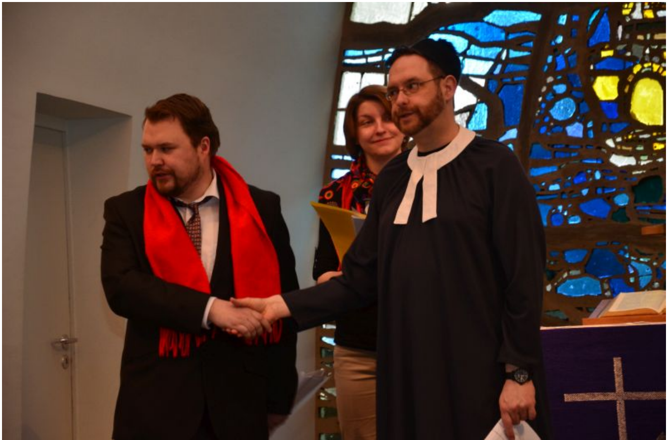
Probenszene aus „Donnerhall und Glockenläuten“