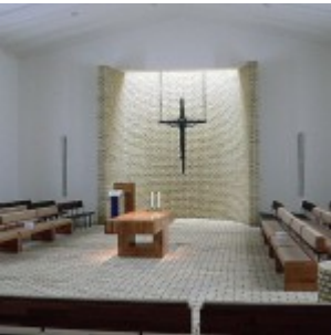
Innenansicht der Christuskirche in Rünthe.