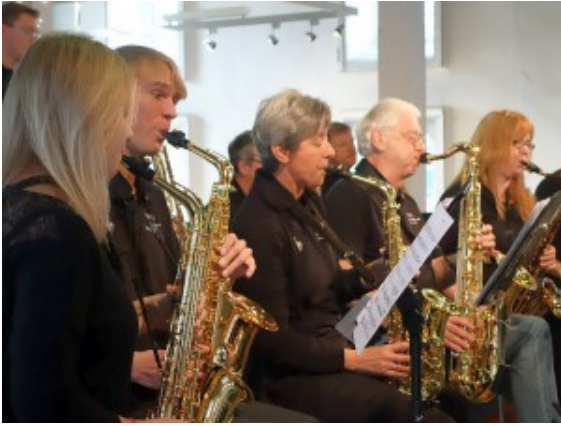
Die Saxophone der Big Band der Musikschule Bergkamen