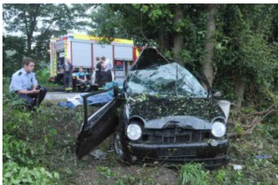
Der Unfallwagen.

Bergkamen. Sie sind tot. Die beiden jungen Männer (21 und 20 Jahre), die mit ihrem VW Polo auf der Erich-Ollenhauer-Straße von der Straße abgekommen sind, haben den Unfall nicht überlebt.