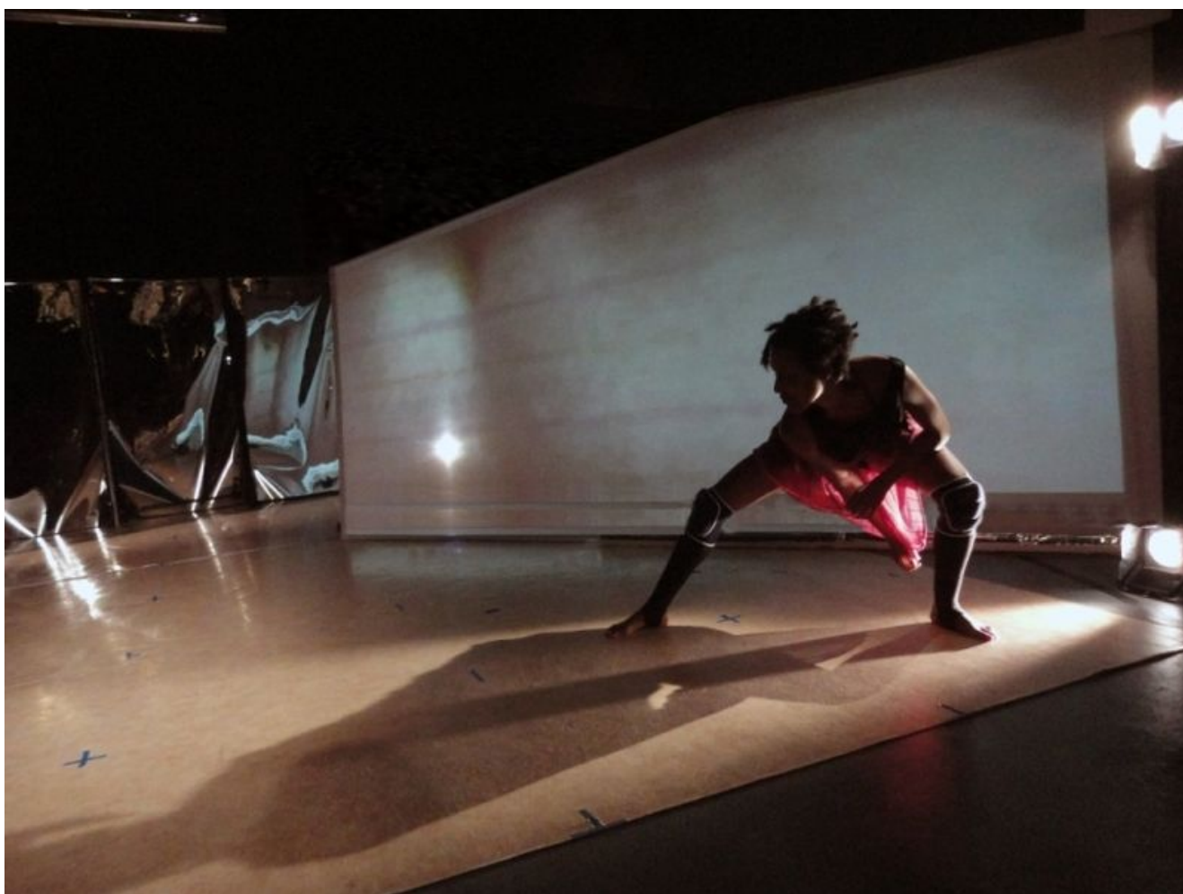
Die französischen Compagnie ACTA.

Informationen gibt es in der Jugendkunstschule 02307 9835027. Kartenvorverkauf im Kulturreferat 02307 965464.