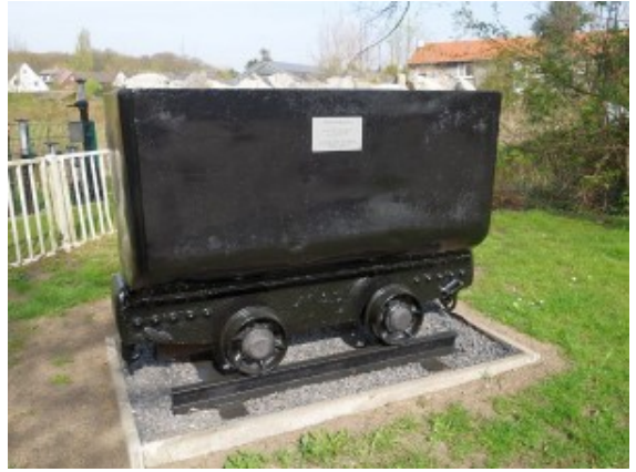
Diese Lore stand ursprünglich am Wellenbad in Weddinghofen.