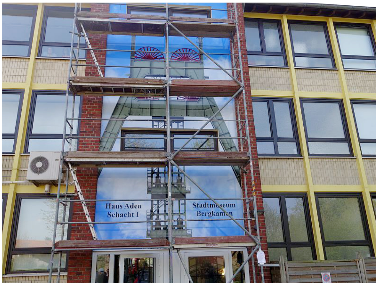
Riesenfoto vom Förderturm Haus 1 am Stadtmuseum

Bis dahin sollen, so die Planung, zwei Lehrstollen, ein modernes und eins mit historischem Bezug, den Besuchern in etwa einen realistischen Eindruck von der Arbeit auf den ehemals drei Bergkamener Bergwerken vermitteln.