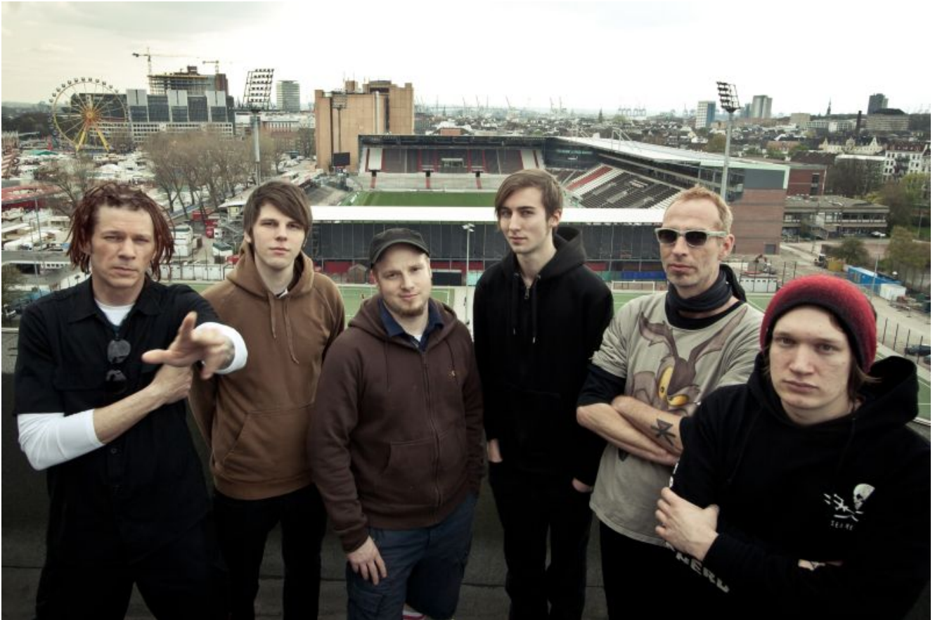
Rantanplan aus Hamburg

Rantanplan gelten als die Skapunkband in Deutschland schlechthin. Die Band spielt einzigartige Shows, die oft länger als zwei Stunden dauern. Und eins ist sicher: Dem Hamburger Rudel gehört der Platz zwischen den Stühlen von Ska und Punk wie keiner zweiten Band. Diese Symbiose ist möglich und extrem partytauglich.