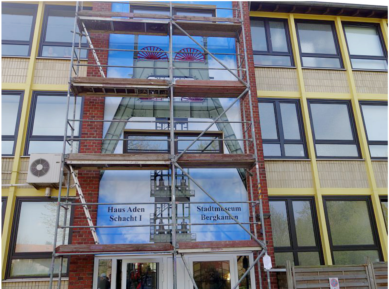
Riesenfoto vom Förderturm Haus 1 am Stadtmuseum

Bis dahin sollen, so die Planung, zwei Lehrstollen, ein modernes und eins mit historischem Bezug, den Besuchern in etwa einen realistischen Eindruck von der Arbeit auf den ehemals drei Bergkamener Bergwerken vermitteln.