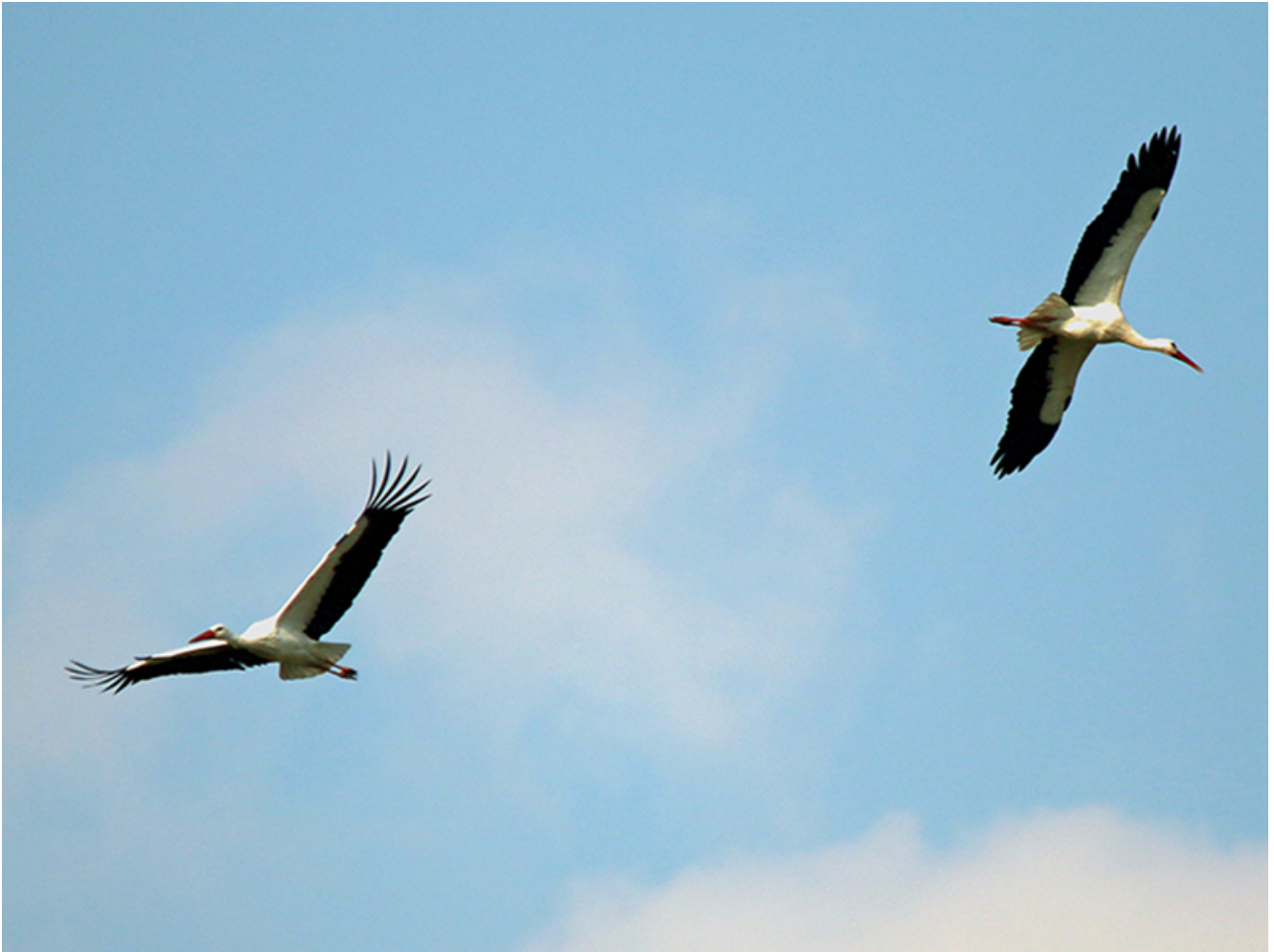
Störche schweben über den Lippeauen.