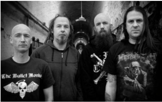
Gods Will Be Done

werden dann mit einer Spezialaktion den Abend beenden.