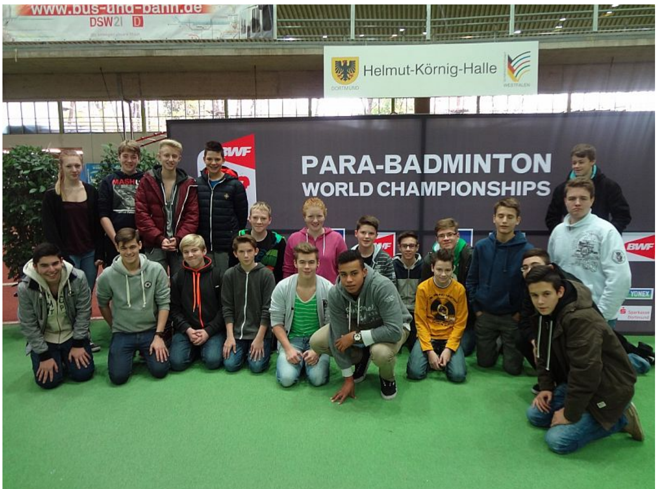
Die 9 b der Realschule bei der Para-Badminton

Die Klasse 9b der Realschule Oberaden besuchte die Weltmeisterschaften im Badminton für Menschen mit Behinderung, an denen über 250 Spieler und Spielerinnen aus 38 Nationen teilnahmen.