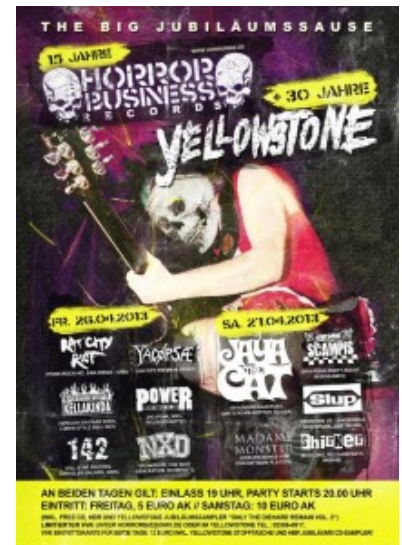
Plakat zur Doppeljubiläumsparty im Yellowstone

30 Jahre alt wird das Oberadener Jugendzentrum Yellowstone und das Selmer Label „Horror Business Records“ 15 Jahre. Grund genug, dies mit einer zweitägigen Geburtstagsfeier am letzten April-Wochenende zu feiern.