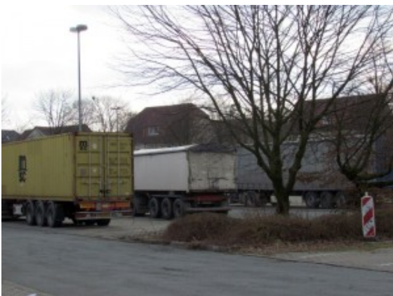
Der Parkplatz am

Vielleicht hätte heute die Stadt ein Problem weniger, wenn sich die Politik vor rund einem Dutzend Jahren anders entschieden hätte. Damals lagen im Bergkamener Rathaus Pläne für den Bau eines Autohofes vor – genau dort, wo sich heute die leere Fläche des Logistikpark A2 an der Autobahnzufahrt befindet.