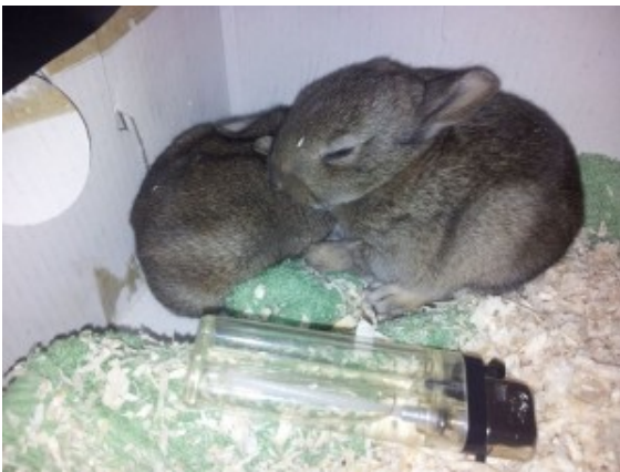
Die verwaisten Hasenkinder

Die Polizei fahndet nach dem Osterhasen. Besser gesagt: Sie sucht in Form eines offenen Briefes nach einer Häsin, die zwei ihrer Jungen vermisst.