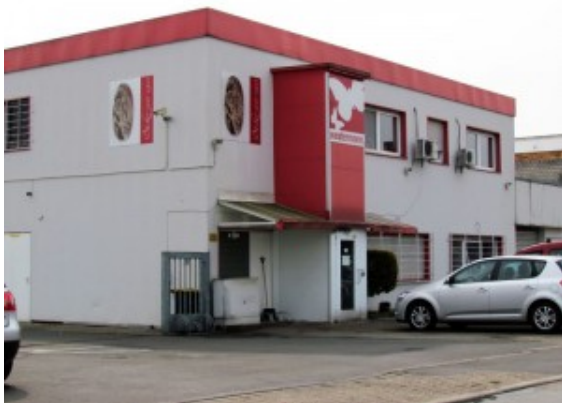
Bäckerei Westermann in Oberaden.